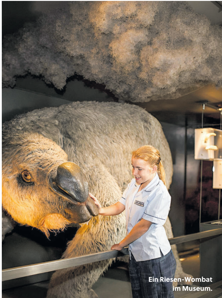
Ein Riesen-Wombat im Museum.

Dann kamen die Menschen. Die älteste bisher bekannte Ausgrabungsstätte, der Madjedbebe-Felsunterstand, wird auf etwa 65.000 Jahre geschätzt. Menschen und (Riesen-)Tiere teilten sich den Lebensraum, bevor es vor rund 55.000 Jahren zu einem Aussterben der Megafauna kam. „Die Koinzidenz mit der Ankunft der Menschen ist augenfällig“, so Christian Grataloup in seiner Geoeschichte. Dafür macht er weniger die Jagd als anthropogene Umweltschäden verantwortlich, an erster Stelle die auch von den Aborigines praktizierte Brandrodung. Dadurch wurden einst dichte Wälder gelichtet, es entstanden Savannen und aus Graslandschaften wurden Wüsten. Alexandra Bleyer